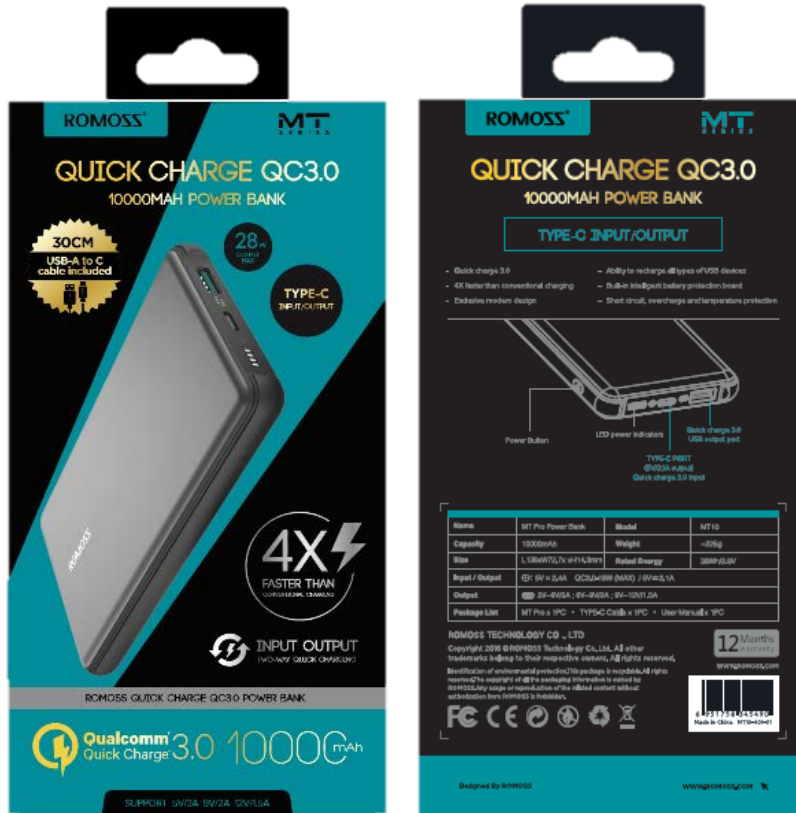
جعبه بسته بندی