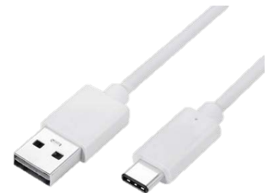
کابل ۳۰ سانتی متری با دو سر A و C